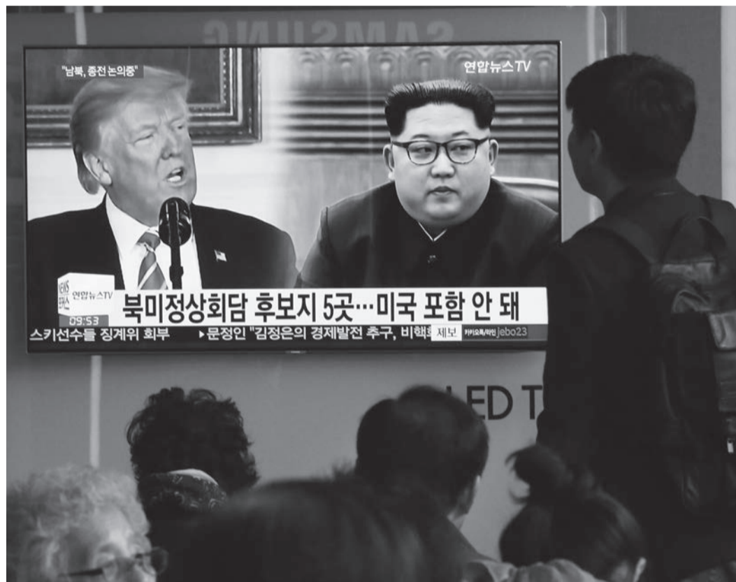
米朝対話の進展に、国際社会は胸をなでおろすが……。

北朝鮮の核・ミサイル問題をめぐり、不気味な「平和ムード」が漂い始めました。「戦争は免れた」と安心する向きもあります。しかし、これから数年の流れを冷静に読めば、日本にとって最悪のシナリオが始まろうとしていることが分かります。